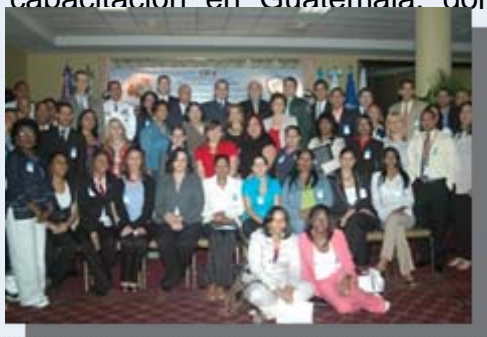
Guatemala y El Salvador

Del 28 de febrero al 4 de marzo de 2011 se llevó a cabo una nueva capacitación en Guatemala, donde participaron 75 personas de diversas