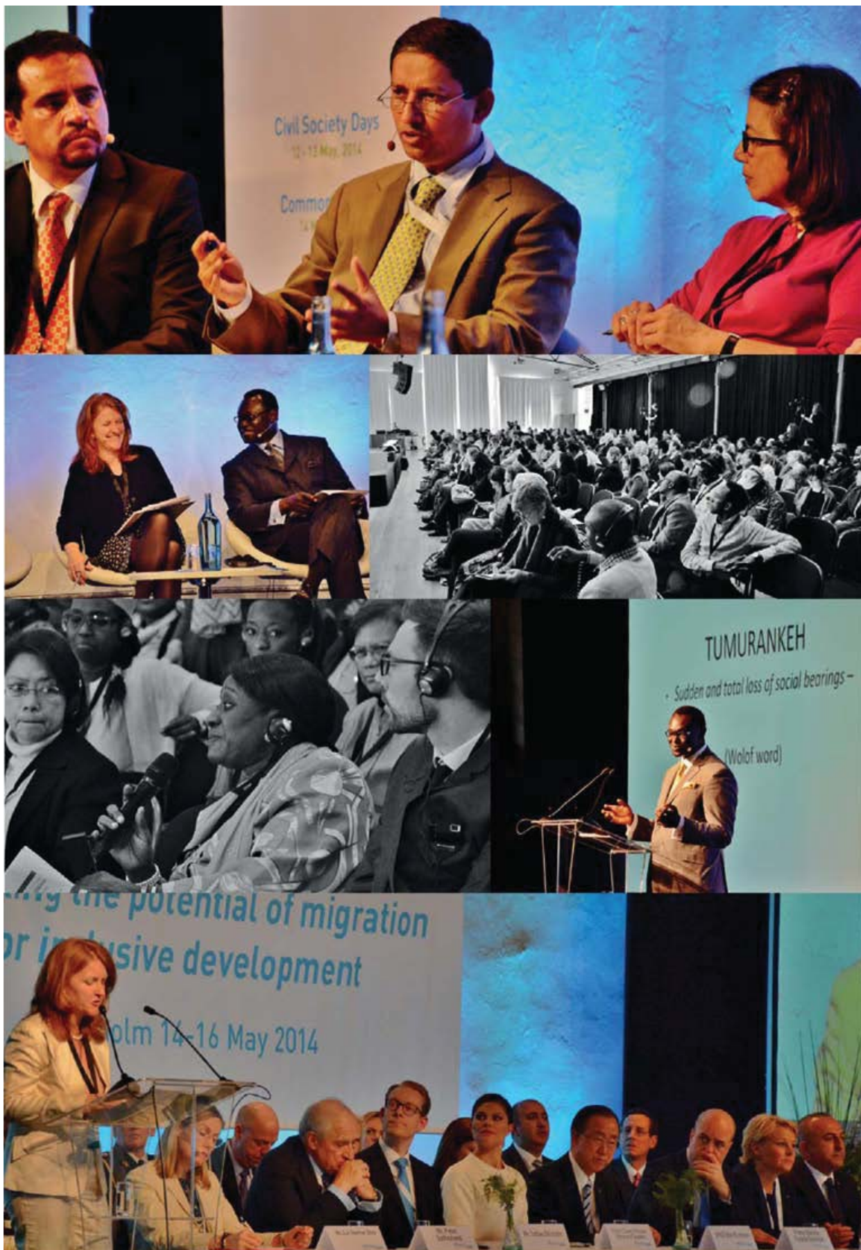
Fotos de las Jornadas de la Sociedad Civil del FMMD y la presentación de informes en la ceremonia de apertura del Espacio Común.