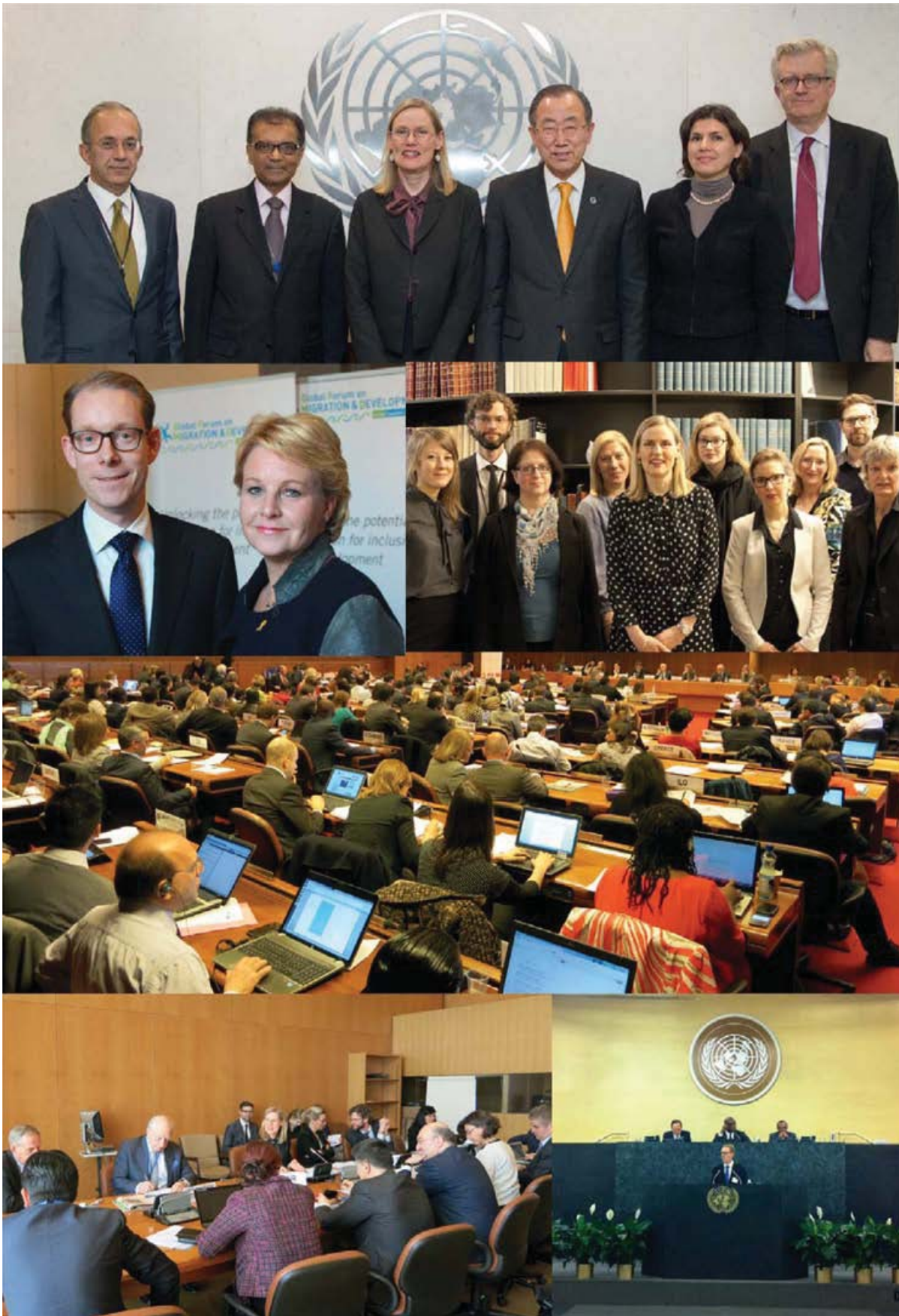
Fotos del proceso preparatorio.