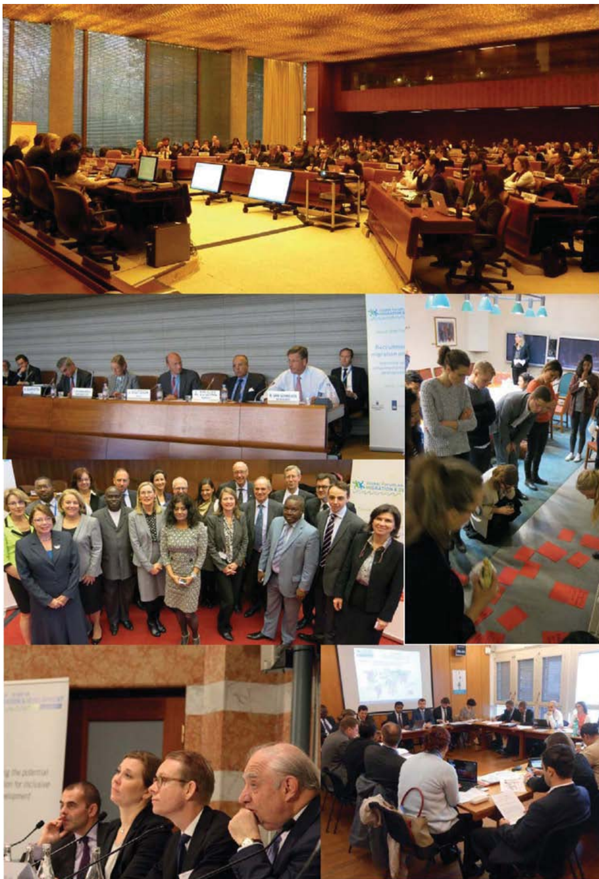
Fotos del proceso preparatorio.